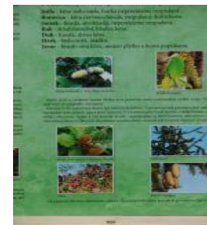
Časť druhej informačnej tabule o rastlinstve a živočíšstve