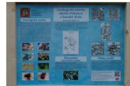
Tretia tabuľa o geológii a baníctve umiestnená na konci trasy