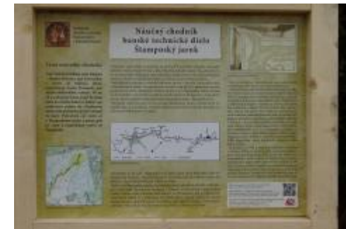
Prvá všeobecná informačná tabuľa na začiatku trasy

Pukanská časť jarku, ktorá ide proti toku vody, sa začína na Strákotke. Z námestia tam vedie zelená turistická značka, ktorá pokračuje na Krížny buk. Trasa pokračuje cez Babú dolinu, ponad Chudú do Hampochu, kde sa končí a napája sa na štátnu cestu a späť do Pukanca. Trasa meria približne 2 km a sú na nej umiestnené 3 náučné tabule.