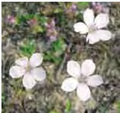
Ľan tenkolistý (Linum tenuifolium)