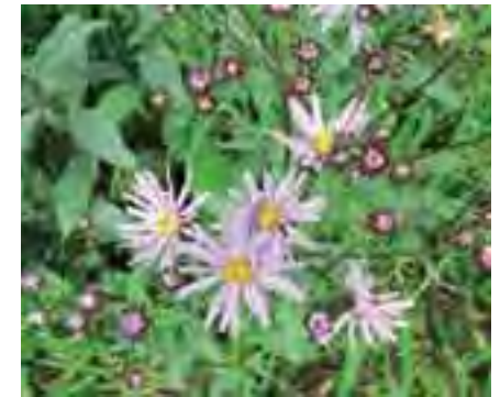
Astra spišská ( Aster amelloides )

zachovanie potrebné. Hrozbu pre ich ďalšiu existenciu predstavuje nielen prirodzená sukcesia, ale najmä možnosť zavlečenia invázných druhov a možné snahy o intenzifikáciu poľnohospodárskeho využitia alebo naopak, zalesnenie lokality. Nevhodné je aj využívanie územia na jazdenie na terénnych motorkách.