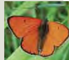
Ohniváčik veľký ( Lycaena dispar )