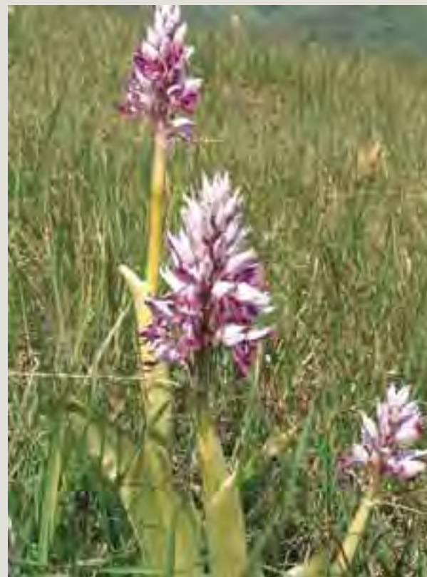
Vstavač vojenský ( Orchis militaris )