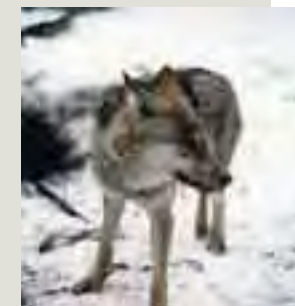
Vlk dravý ( Canis lupus )