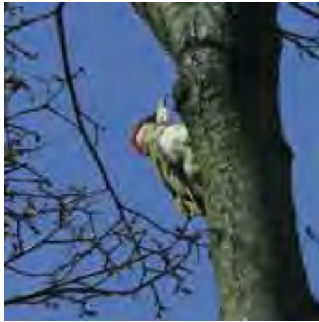
Žina zelená ( Picus viridis )