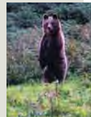
Medveď hnedý ( Ursus arctos )