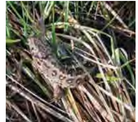
Jašterica bystrá ( Lacerta agilis )