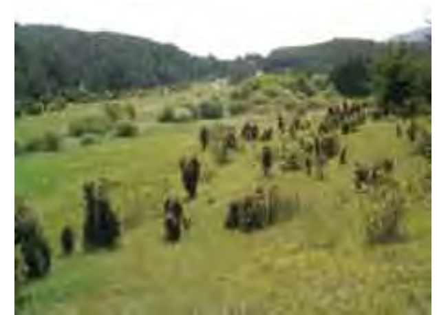
Porasty borievky v území

Cennou súčasťou lokality sú najmä travinnobylinné spoločenstvá tvoriace významný biotop suchomilnej a teplomilnej flóry a fauny. Osobitný ráz oblasti dotvárajú porasty borievky obyčajnej s prímiesou borovice lesnej a teplomilných drevín, najmä krov. Časť plochy pokrýva lesný porast. Územie sa