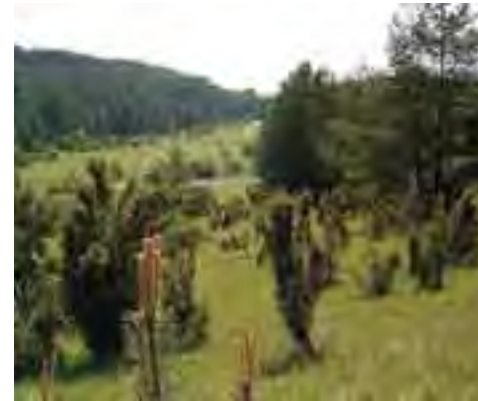
Postupujúca sukcesia drevinovej vegetácie