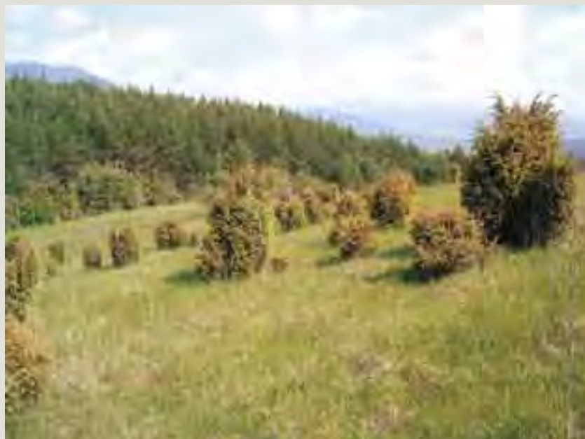
Porasty s borievkou obyčajnou ( Juniperus communis )