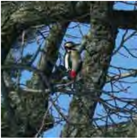
Ďateľ veľký ( Dendrocopos major )