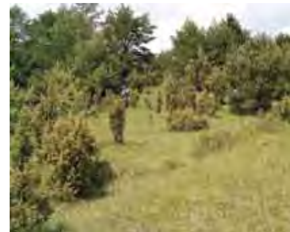
Zarastajúce opustené pasienky

Vypracovaniu programu starostlivosti s navrhovanými opatreniami bude predchádzať ich prerokovanie so zainteresovanými vlastníkmi a užívateľmi územia. Nezávisle na tomto procese môžete s otázkami a návrhmi už teraz kontaktovať pracovníkov ŠOP SR – Správy NP Veľká Fatra.