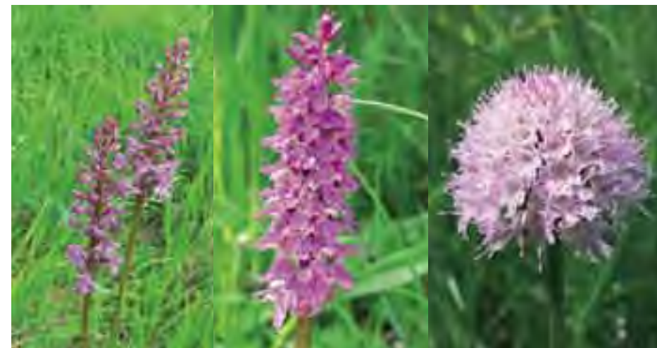
Päťprstnica obyčajná (Gymnadenia conopsea)

Vypracovaniu programu starostlivosti s navrhovanými opatreniami bude predchádzať ich prerokovanie so zainteresovanými vlastníkmi a užívateľmi územia. Nezávisle na tomto procese môžete s otázkami a návrhmi už teraz kontaktovať pracovníkov ŠOP SR – Správy NP Veľká Fatra.