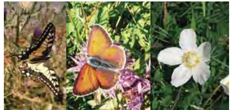
Vidlochvost feniklový ( Papilio machaon )

Geologický podklad územia je tvorený horninami s vysokým obsahom vápnika a zásadité, na živiny bohaté, i keď väčšinou plytké sú aj pôdy, ktoré sa na ňom vyvinuli.