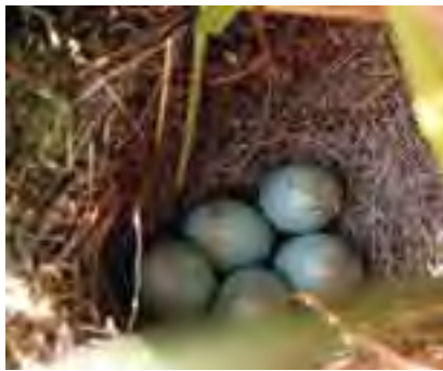
Znáška prhlaviara červenkastého ( Saxicola rubetra )